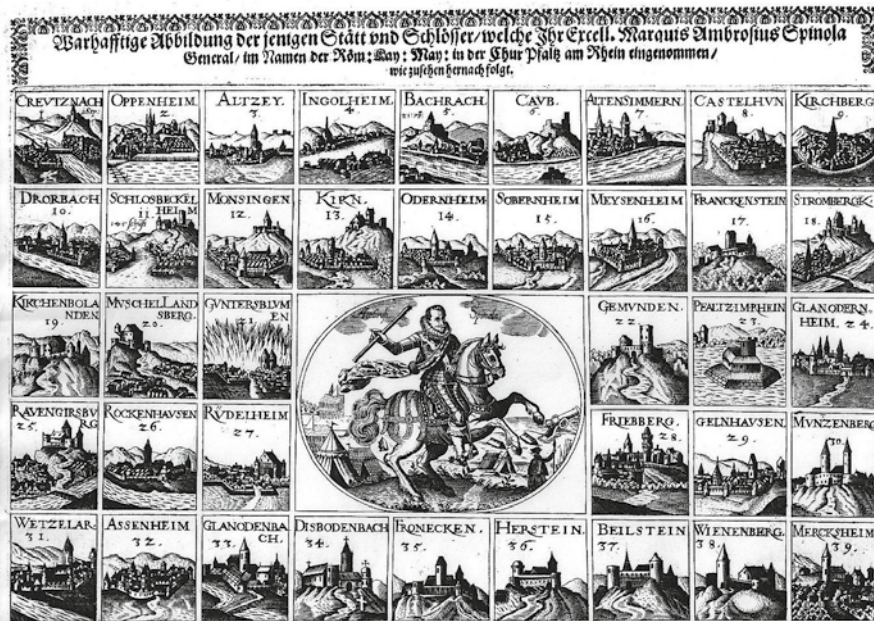
Abb. 6: Wahrhaftige Abbildung derjenigen Städte und Schlöffer, welche Ihre Excell[enz] Marquis Ambrosio Spinola, General, im Namen der Röm. Kay. Maj. in der Kur Pfalz am Rhein Eingenommen, Flugschrift Augsburg 1621 (Staats- und Stadtbibliothek Augsburg)

Exklusive Münzprägungen , Sonderbriefmarken zum Westfälischen Frieden und die gehäufte Zahl an Tagungen und Büchern – letztere blieben keineswegs nur auf das Genre der Fachliteratur begrenzt – trugen in ihrer Gesamtheit ebenfalls dazu bei, dass die drei Jahrzehnte zwischen 1618 und 1648 unvergessen blieben.