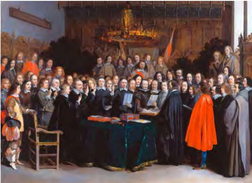
Abb. 1: Die spanischen und niederländischen Gesandten beschwören im Rathaussaal am 15. März 1648 den Frieden von Münster. Gemälde von Gerard ter Borch, 1648. Öl auf Kupfer (Rijksmuseum Amsterdam)

Der Dreißigjährige Krieg ist wie kaum ein anderer europäischer Konflikt – vielleicht abgesehen von den beiden Weltkriegen im 20. Jahrhundert – in der landläufigen Memoria präsent. Für die Unsterblichkeit in und aus dieser Zeit sorgten die Jubiläums- und Gedenkfeiern , die keineswegs nur die evangelischen Kultur- und Konfessionsregionen alle 25, 50 bis 100 Jahre beeindruckten, sondern auch literarische und bühnenreife Reflexionen um und auf den Krieg und dessen Protagonisten,